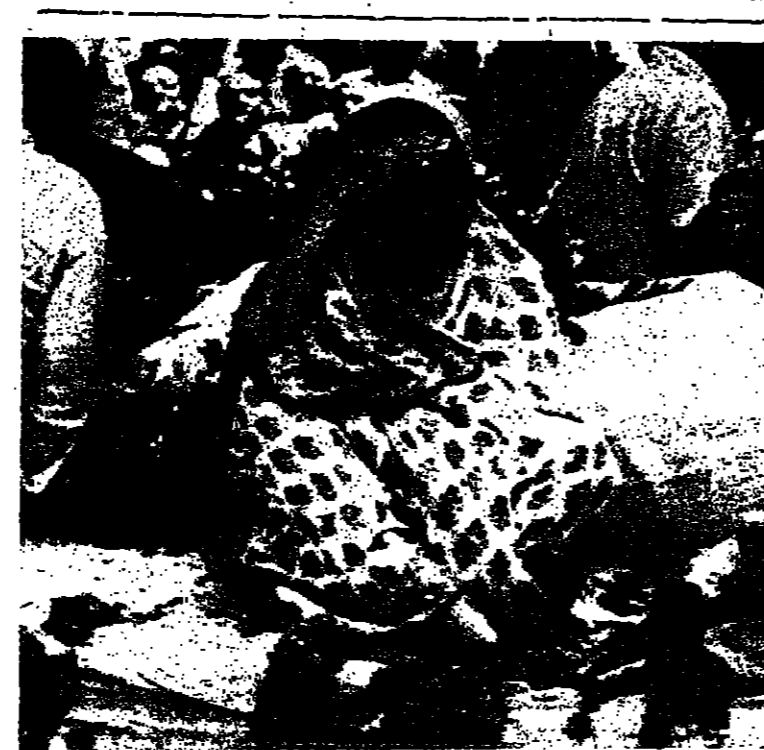
حداد انجرا غاندي على وفاة نجلها صورة للاجلاء من بيتايتديرس

ومره تانية مولود في جسر دائمية ارحبا - مكتب الصحافة المتحدة - ذكر مصدر مسؤول في ادارة الحكم العسكري ان امرأة من جنين وضعت مولودا يوم امس في جسر دائمية وقد اشراف على عملية الولادة احد اعضاء جيش الدفاع الاسرائيلي وتم نقل السيدة الى جنين بعد الانتهاء من عملية الولادة، وهذه هي المرة الثانية التي تضع فيها سيدة مولودا في جسر دائمية خلال الايام العشرة الماضية.